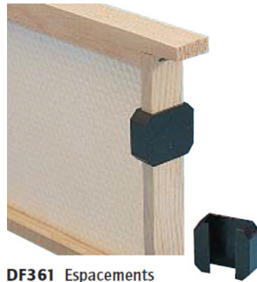
DF361 Espacements Hoffman plastique