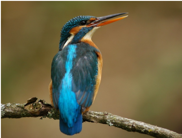
Martin Pêcheur perché...

C'est un oiseau qui mange des petits poissons et des petits animaux aquatiques, il vit à proximité des étendues d'eau, où il peut se nourrir en abondance. Sa proie repérée, généralement depuis un perchoir, il plonge en percutant violemment la surface de l'eau l'attrape, puis l'avale, tête la première, dans le sens des écailles. Si elle n'est pas dans le bon sens, il lance sa proie en l'air et la rattrape avec agilité dans le sens qui lui plaît.