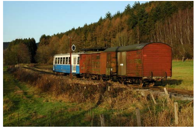
Ancien signal et train de travaux près du dépôt de Blier.

Schepdael (Amutra Bruxelles) créent le TTA (Tramway Touristique de l'Aisne ASBL). Le premier tram retrouve la vallée de l'Aisne le 24 juin 1966. Suivent 41 années de passion aux cours desquelles les animateurs du TTA préservent plus de septante véhicules historiques (dont 4 locomotives à vapeur et 5 autorails) et entretiennent l'ultime témoignage en Belgique des antiques lignes vicinales rurales.