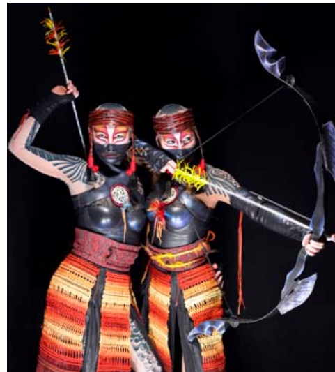
Des archers et des lanciers pourchassent sans relâche les jumeaux.

Naufrage en mer, plage mystérieuse, montagnes menaçantes, forêts inhospitalières constituent les embûches dont leur route est semée.