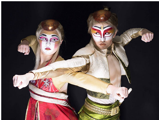
Les jumeaux impériaux.

KÀ est une histoire qui parle de conflit et d'amour entre deux jumeaux impériaux séparés lors de leur enfance et qui doivent passer des épreuves initiatiques pour se découvrir. Il leur faudra, entre autre découvrir le KÀ qui symbolise le feu et sa dualité : la destruction et l'illumination.