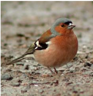
Pinson des arbres

Identification : taille d'un moineau, calotte noire, bec courtaud, croupion blanc et queue noire. Le mâle a une poitrine rose vif, la femelle grise légèrement rosée. A ne pas confondre avec le pinson des arbres ou le rouge-gorge.